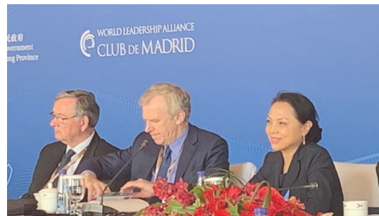
参加高端国际学术论坛（左二为比利时前首相伊夫莱姆姆）

陈平教授目前作为高端引进人才在中国暨南大学建立了文化遗产创意产业研究院并出任院长。2017年至2019年，连续策划、创办了“一带一路文化遗产合作与交流国际高峰论坛”，至今已经与北京、丽江、江门等地方政府进行了友好合作，以文化遗产为核心话题，累计邀请了五十多个国家的学者、官员与手工艺大师进行文化的交流与探讨，取得了非常好的社会效益。