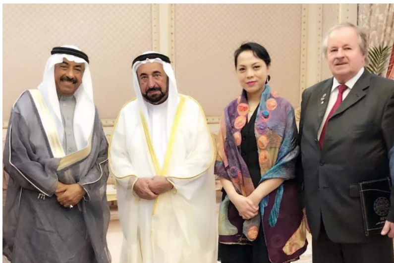
沙迦现任国王 HisHighnesses Dr. Sultan Al Qasemi , Ruler of Sharjah UAE（苏丹·卡西米）会见国际民间艺术组织主要官员。