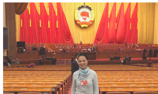
当选为全国政协第十三届二次会议海外代表