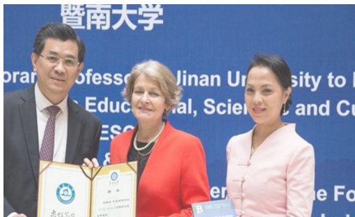
邀请前任联合国教科文组织总干事伊莲娜·博科娃女士出席 研究院两周年庆典仪式

在欧洲的二十多年里，她始终坚持不懈地致力于全球的文化遗产、特别是民间艺术的保护、挖掘、整理与传播工作，积极参与联合国教科文组织非物质文化遗产保护非政府组织的合作、交流与建设工作，作为一位华裔学者，在国际舞台上不断地为推广中国的文化发出声音，努力推动东西方学术界的交流与合作，从2007年开始，利用自身资源，为中国文化遗产与非物质文化遗产提供了大量的技术咨询工作：2008年，她首度向南京市政府有关领导提出建议南京大屠杀纪念馆尽快通过申报“世界记忆名录”；并将正在申报联合国教科文组织非物质文化遗产名录的传统手工艺技艺南京云锦带到了美国进行展演，参加学术交流，起到了良好的国际推广作用，助推其申遗成功。2016年，她为中国争取到了联合国教科文组织正式节庆活动意大利著名的街头传统游戏艺术节（TOCATI）的主宾国地位，并带领来自中国民间的一百多位街头体育爱好者进行了表演与交流，体现出了民间外交的魅力与作用。