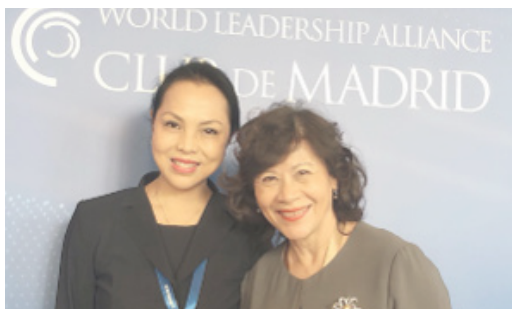
与前任联合国副秘书长、新加坡社会科学家黑泽尔教授

陈平教授目前作为高端引进人才在中国暨南大学建立了文化遗产创意产业研究院并出任院长。2017年至2019年，连续策划、创办了“一带一路文化遗产合作与交流国际高峰论坛”，至今已经与北京、丽江、江门等地方政府进行了友好合作，以文化遗产为核心话题，累计邀请了五十多个国家的学者、官员与手工艺大师进行文化的交流与探讨，取得了非常好的社会效益。